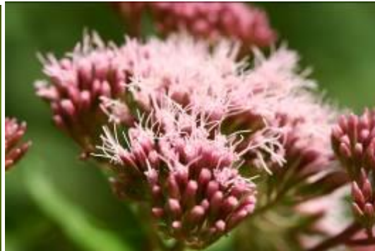
Eupatorium (Wasserdost)