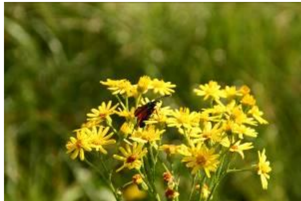
Senecio (Greiskraut)

Die Pyrrrolizidin-Alkaloide können durch beständige Aufnahme in den Körper zu Leberschäden (chronische Giftigkeit) führen. Zudem stehen einige der PA in Verdacht krebserregend (kanzerogen) und erbgutschädigend (genotoxisch) zu sein. Es besteht die Möglichkeit, dass Lebens- oder Futtermittel potentiell mit PA belastet sein können. Eine mögliche Gefährdung von Weidetieren durch die Ausbreitung von Senecio jacobea (Jakobskreuzkraut) sowie anderen Senecio -Arten auf Weiden wird diskutiert. Die Ausbreitung auf Wiesen ist bedenklicher, da durch das Mähen PA-haltige Pflanzen in Heu oder Silage „versteckt“ sein können. PA wurden