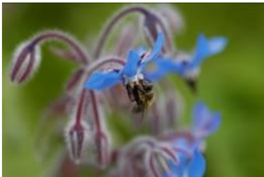
Borago (Borretsch)

Pyrrrolizidin-Alkaloide (PA) sind eine Gruppe von pflanzlichen Sekundärstoffen die über 660 verschiedene Strukturen umfasst. PA schützen die Pflanze vor Fressfeinden. Das Vorkommen toxischer PA ist nahezu ausschließlich auf vier nicht direkt miteinander verwandter Pflanzenfamilien beschränkt; Asteraceae (Senecioneae und Eupatorieae), Boraginaceae, Apocynaceae und den Genus Crotalaria innerhalb der Fabaceae. Nicht jedes PA ist toxisch. Die Toxizität hängt von Veränderungen an der Grundstruktur ab (reduzierte Form, Doppelbindung 1-2 C-Atom, Veresterungen, etc.).