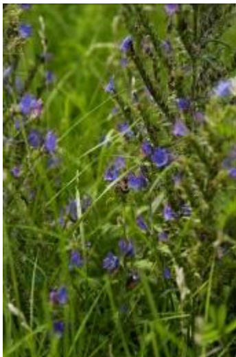
Echium (Natternkopf)